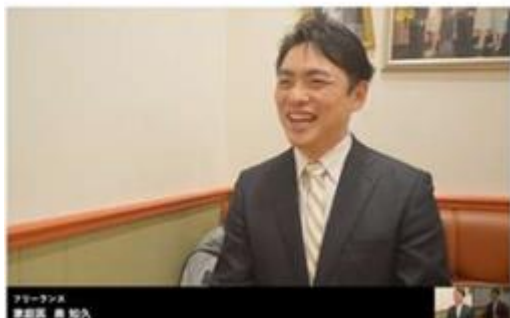
山梨県サンクール石和の相談会にて講師を務めていただいた奥医師